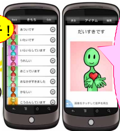
Voice4u (ボイスフォーユー)

絵をタッチすると、その絵が表す言葉をしゃべってくれます。最近の携帯電話などで使えます。