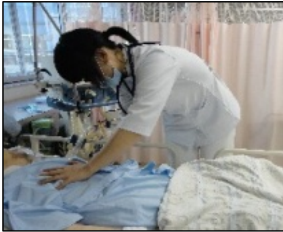
理学療法士による呼吸介助訓練場面

当院の呼吸理学療法は、胸部・腹部の手術の前後、脳卒中中で入院された方、急性期・慢性期の呼吸器の病気がある方など様々な状況の患者さんに対して施行しています。