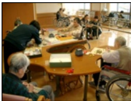
入所でのリハビリ

老人保健施設は在宅に帰る準備をするための施設です。歩行練習やトイレ動作・着替え・食事の方法など日常生活活動の訓練を行います。また、きめこみや和紙などの作業活動・趣味活動を通して寝たきりを予防します。